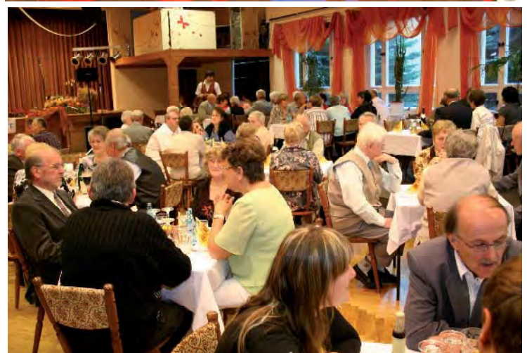
Foto oben: Festveranstaltung 50 Jahre WG am 21.10.2006, Die Hüte, Turnverein Pockau,