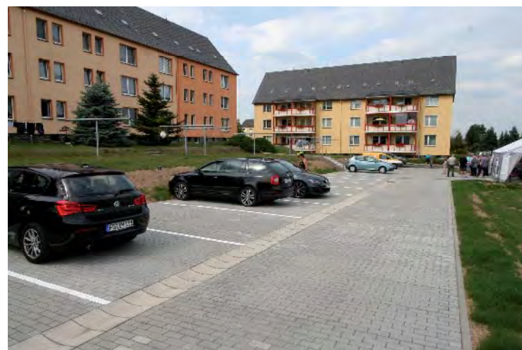
Fotos: Untergrundvorbereitung (Oben) Pflasterarbeiten maschinell (Mitte) Tag der Freigabe (Unten)